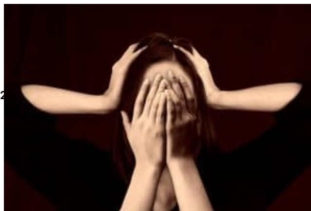
Eemicranie con aura: cosa sono, sintomi, cause